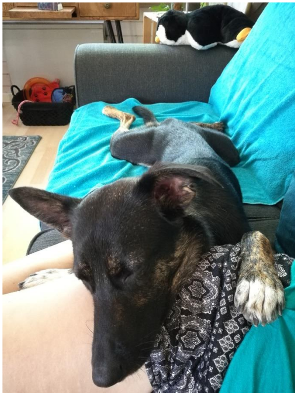
Rina ist natürlich immer mit dabei