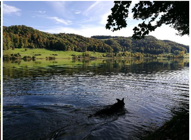
Und noch mehr Wasser^^ Ich habe so viele Bilder einer schwimmenden Rina, dass ich mich kaum entscheiden konnte.