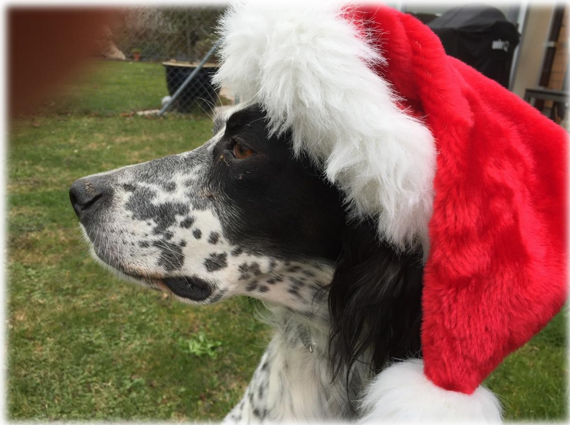
Weihnachtsgrüsse von meinem neuen Zuhause