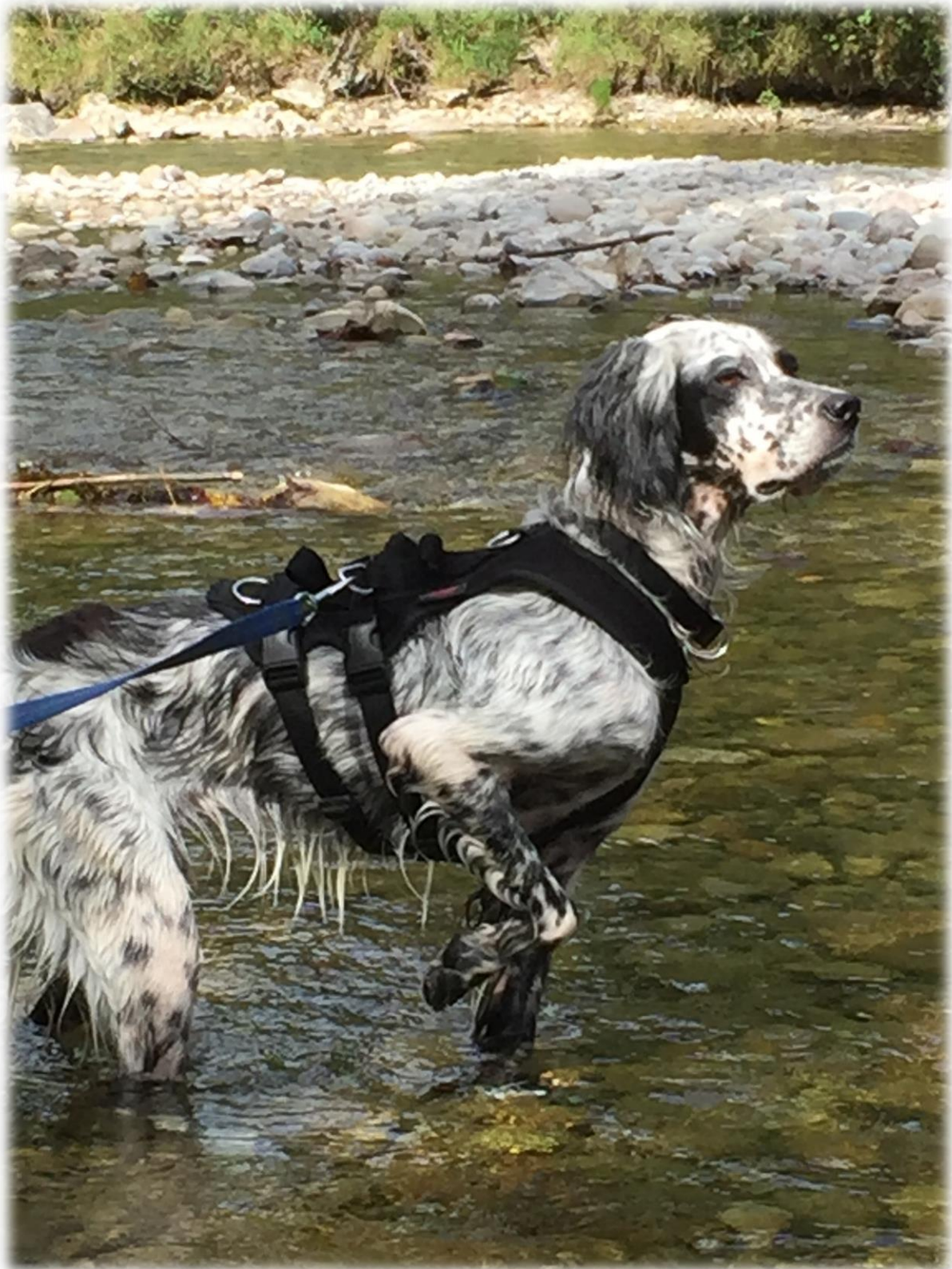
Nun im neuen Zuhause eingezogen, nach dem Baden in der Töss...