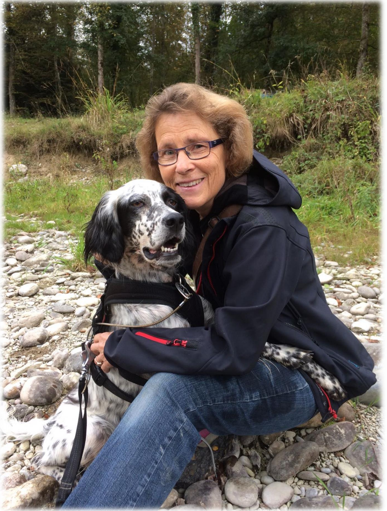
Ausruhen, ganz nahe bei meinem neuen Frauchen