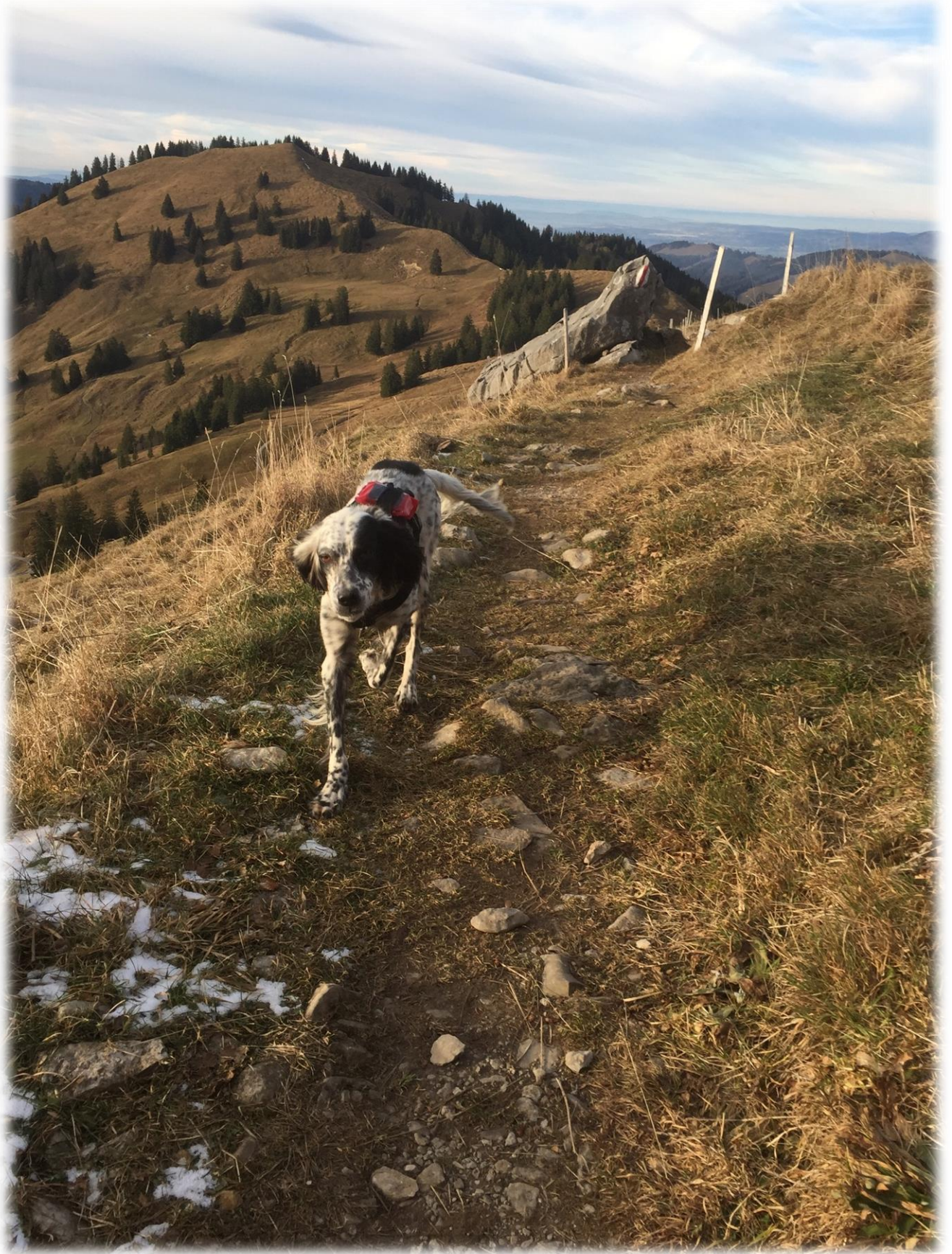
Der erste "Freigang" (mit GPS Gerät, man weiss ja nie..)