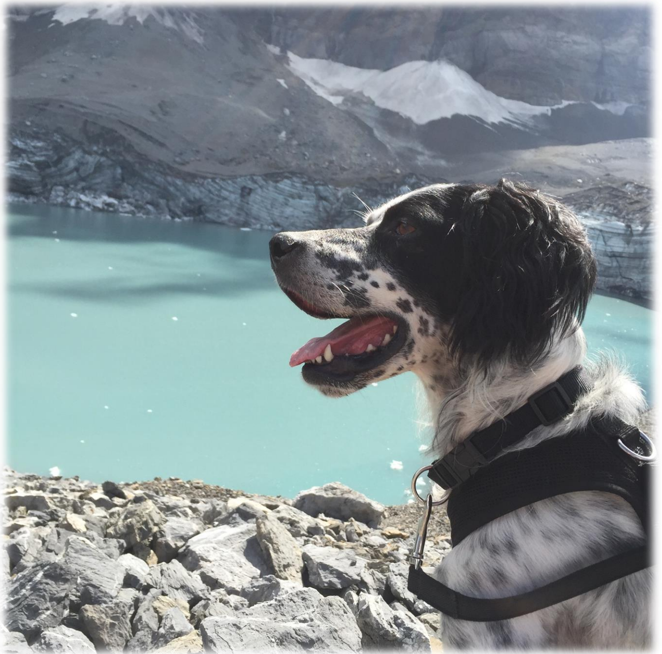
In den Schweizer - Bergen, soo schön!