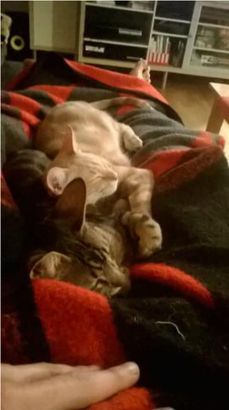
Sofa, Decke, Beine – was braucht man mehr...