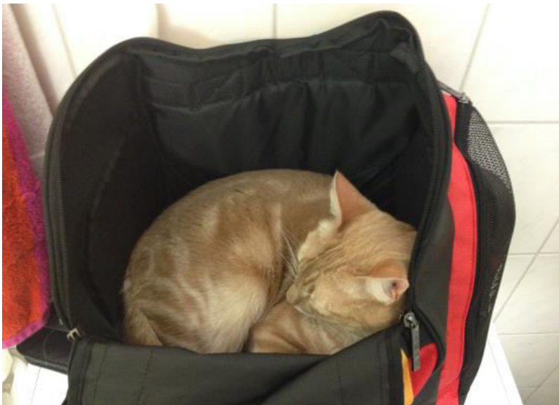
Sport soll ja ganz gut sein, vielleicht versuche ich das auch einmal...