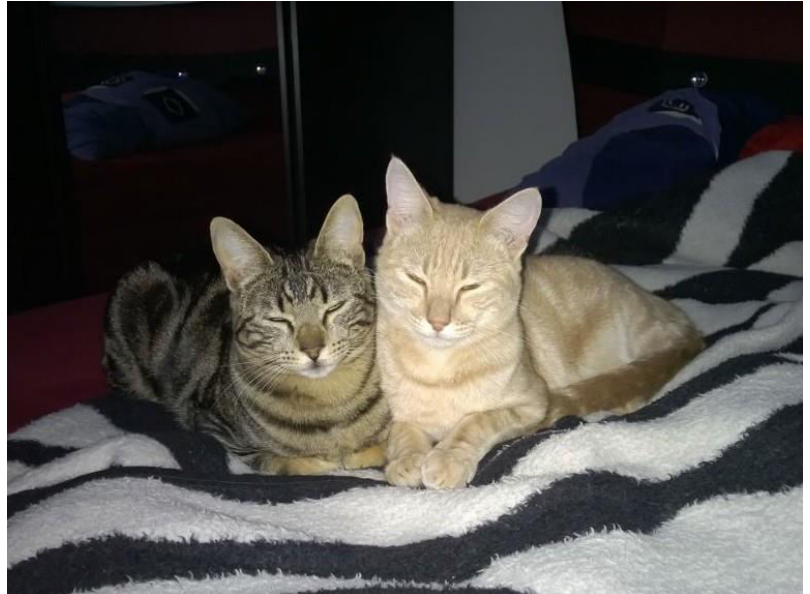
Am liebsten chillen wir gemeinsam auf dem Bett...