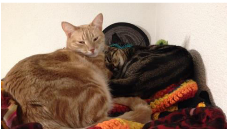
Manchmal findet man uns auch (nach langem Suchen) auf der Garderobe, da hat man eine gute Aussicht und seine Ruhe...