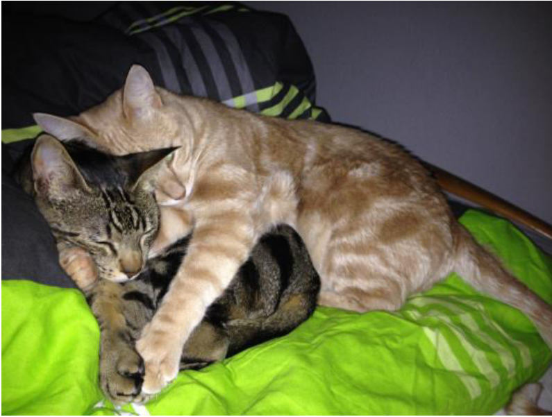
Auch wenn ich der Chef bin, beschütze ich Romano immer wie meinen Bruder...