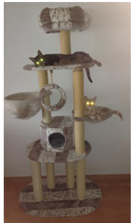
Wir haben euch immer im Blick...