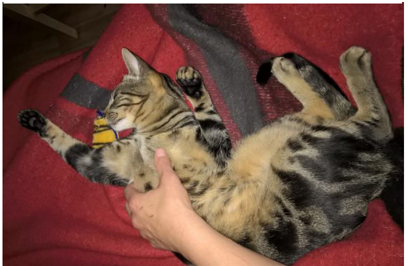
Auch wenn ich etwas scheu bin, liebe ich es exzessiv zu schmuse und gekraut zu werden...