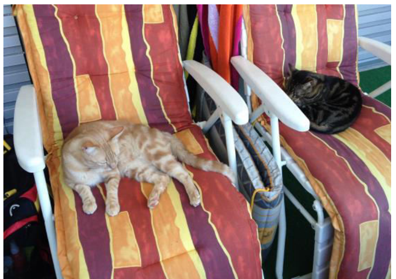
Im Sommer lieben wir es, unseren Platz draussen an der Sonne auf dem geschützten, grossen Balkon zu geniessen...