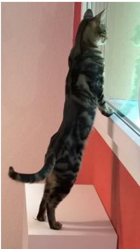
Gerne schaue ich den Vögeln vor dem Fenster zu....